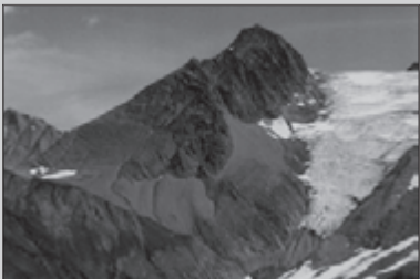
Hoe hoger hoe mooier