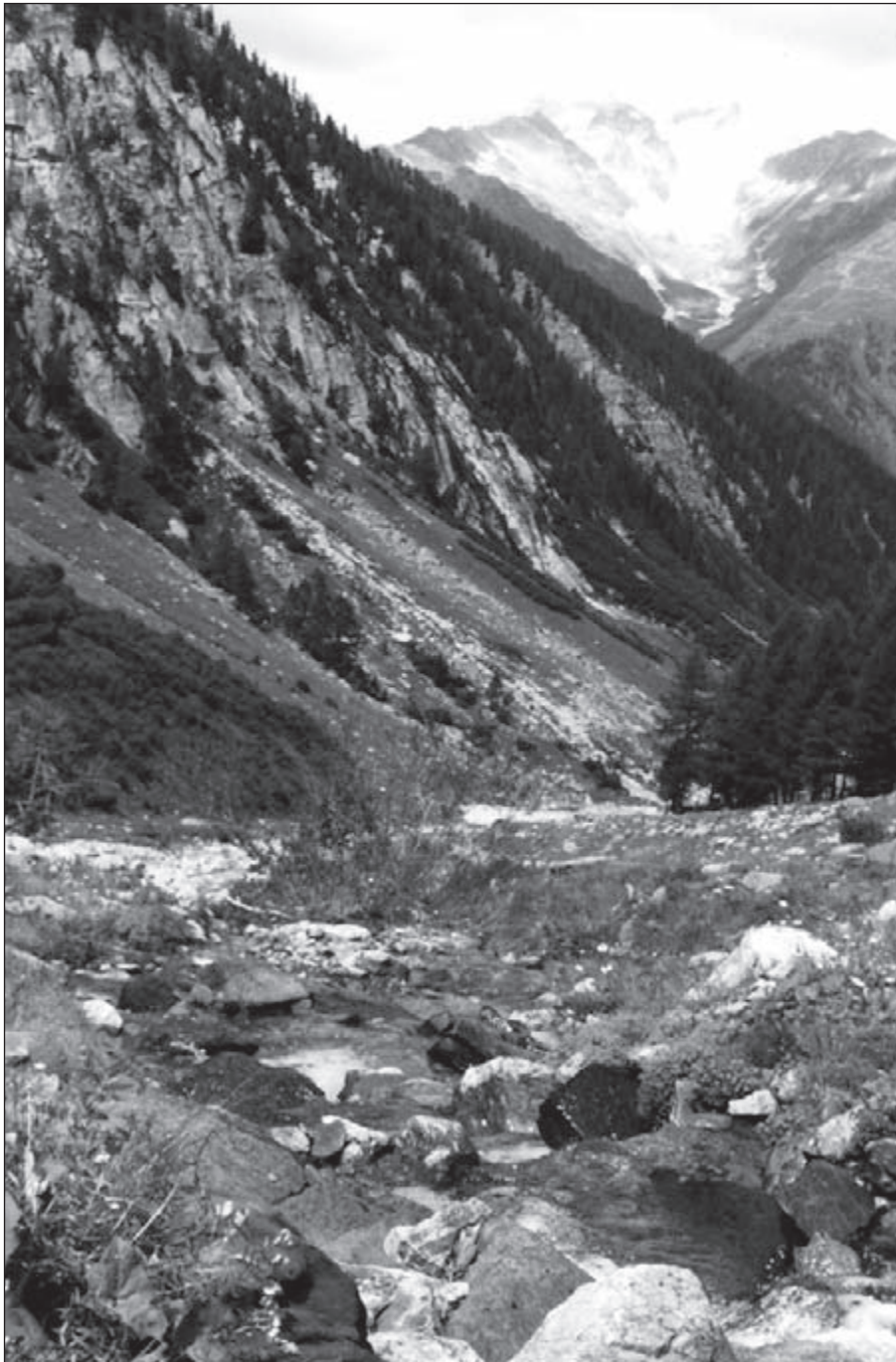
Bron in het Blinnetal op ± 2000m hoogte

en, de fraaiste bergbloemen, bloeiend donzig mos en glashelder water. En dan het uitzicht met voor je uit de als het ware grijpbare gletsjertong en terugblikkend heel ver weg in de diepte het uitgangspunt Reckingen.