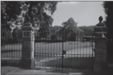
De Famenne, land der valleien