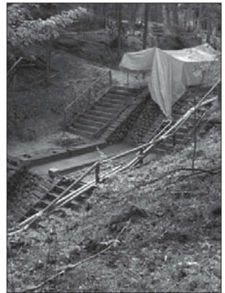
Geen Loenense waterval ditmaal

+++ De tweede wandeldag liep ik met plezier een vertraging van een half uur op, omdat ik toen opliep met Greet Meenken. Deze mevrouw van 86 lentes stond die dag in een landelijk dagblad.