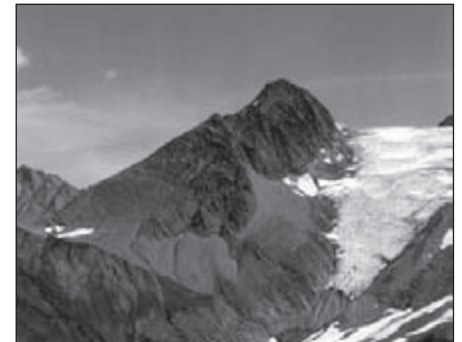
Erner Galen met Rappehorngletsjer

En zo blijft de wandelaar wel bij de les en verveelt zich niet. Regelmatig laat het Murmeltier met zijn scherpe fluittoon weten, dat hij zich tussen die kei-