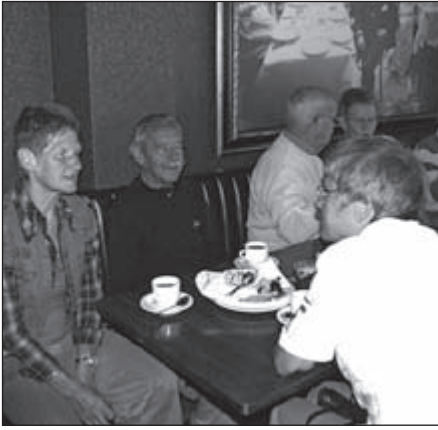
Het begin en het eind van de OLAT Vrijwilligersdag in het Eindhovense Parkhotel