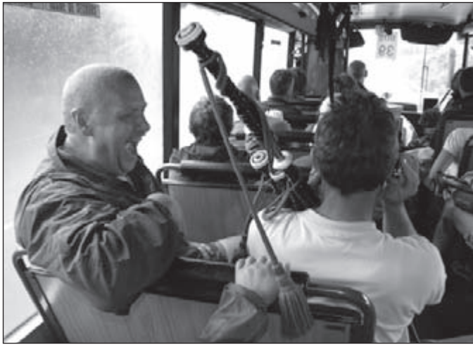
Feestmuziek in de bus terug